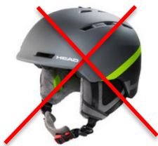
Helm mit „soft ear padding“ (normaler Touristen Ski Helm)

Hier einige Beispiele von NICHT erlaubten Helmen: